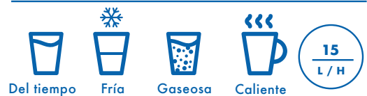
SELFIZZ 15 DEBAJO DE MOSTRADOR