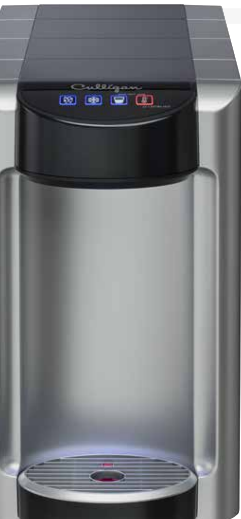
SELFIZZ 15 MOSTRADOR