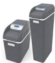
AVENEW 9 Lt